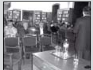
Vállalkozói fórum (5. oldal)