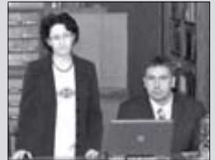
Startol a Start (2. oldal)