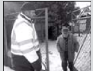
„hálások mindenkinek” (4. oldal)