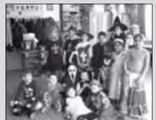
Farsang (6. oldal)